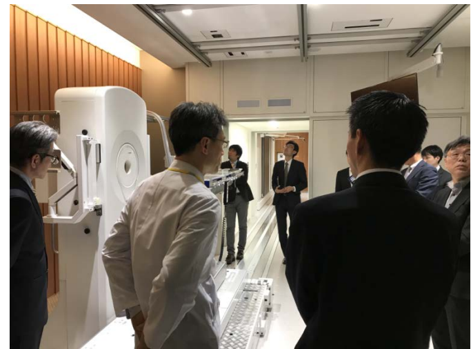
大阪医科大学BNCT関西医療センター見学会