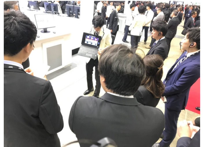
第9回 2019国際医用画像総合展研修会