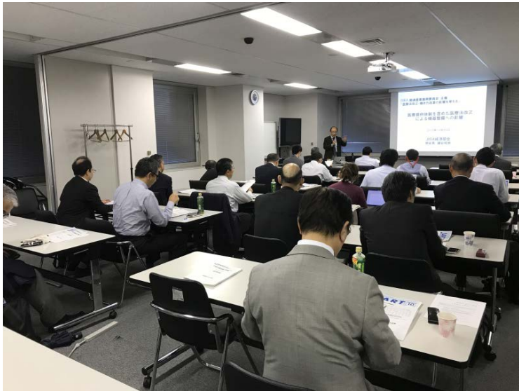
医療法改正・働き方改革の影響を考える 研修会