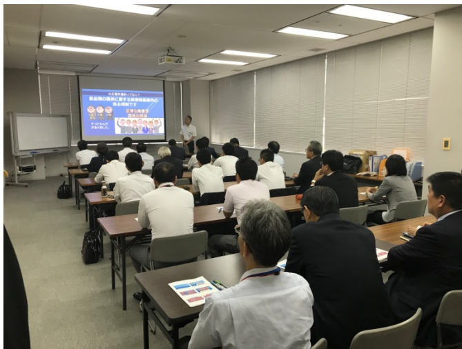
講演会：公正競争規約の基礎と最新動向（大阪）