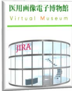
EMMI (医用画像電子博物館)