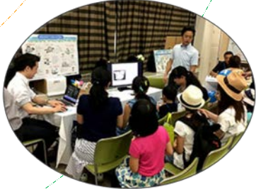
こども霞が関見学デー